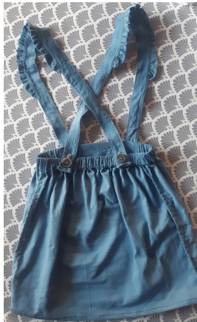
Et verso !!

Bravo pour votre travail, voici une magnifique jupe d'écolière comme du dimanche ! Vous pouvez recommencer avec une cotonnade pour l'été, placer des boutons à l'avant à la naissance des bretelles, changer la largeur ou la longueur des volants !